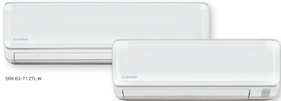
SRK 63-71 ZTL-W